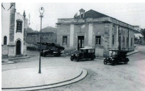
Escola original, junto à igreja de Oeiras.