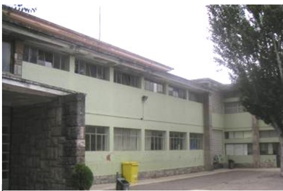
Escola Básica Conde de Ferreira, antes da requalificação levada a efeito no âmbito das Comemorações dos 250 Anos do Município de Oeiras.