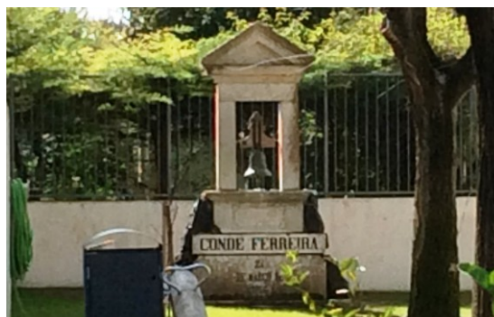
Na atual Escola Básica Conde de Ferreira, conserva-se ainda, no pátio, o frontão com o sino da escola original.